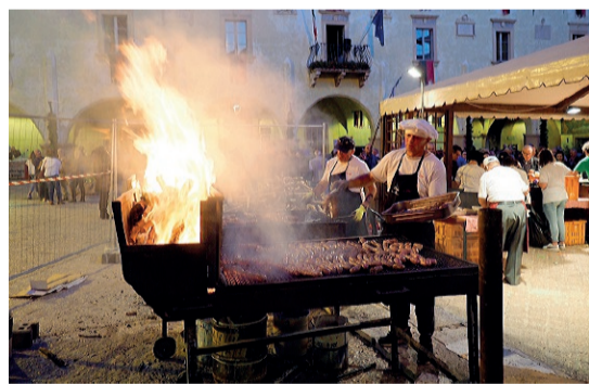
In piazza Tra i prodotti da assaporare anche le salsicce trevane

Oggi nella piazza della Comunità, cuore antico della Città, ultimo evento della lunga kermesse ottobre: la "castagnata" che ormai da anni conclude gli appuntamenti d'autunno. Oltre alle castagne, prodotto della montagna di trevana un tempo famoso, verranno riproposti i prodotti gastronomici locali. Si potranno gustare le saporite salsicce di maiale cotte alla brace su grandi foconi. L'Ottobre a Trevi è il tempo dei sapori autunnali e da tempo immemorabile, come tramandano i documenti, si iniziava la macellazione dei maiali con la produzione di apprezzati insaccati. Ma il principe della cucina trevana è il sedano nero, da assaporare a "cazzimperio" "con l'olio e il sale che fa buono anche uno stivale", recita un antico proverbio popolare. Si